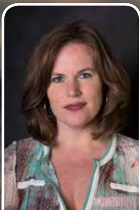
'Creeër innerlijke rust'

Door het trainen van de aandacht word je bewust van je lichaam, gedachten, gevoelens en 'automatische' patronen, zonder te oordelen. Met aandacht kun je bewust kiezen om hier in mee te gaan of om dit te doorbreken. Door (on)bewuste overtuigingen en (emotionele) patronen te herkennen en te doorbreken, creëer je meer innerlijke ruimte en rust om bewust te antwoorden en de juiste keuzes te maken die bij je passen.